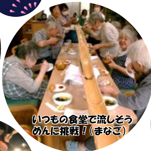
いつもの食堂で流しそう めん挑戦！（まなご）