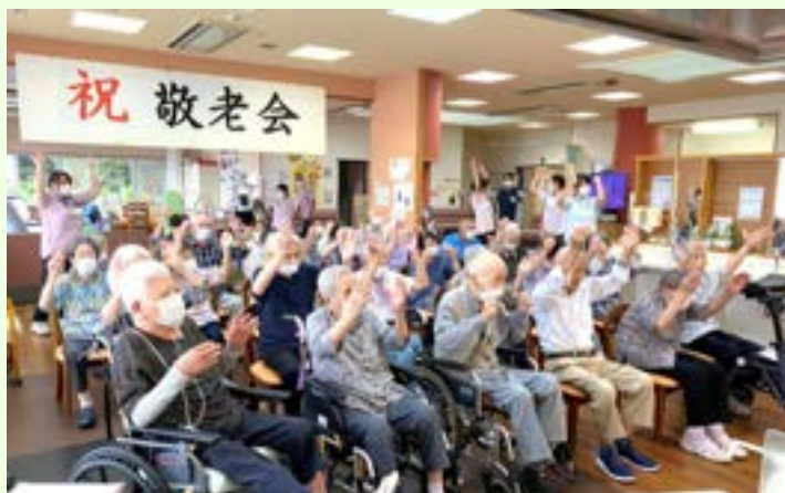
とくち苑デイサービスセンター敬老会の様子