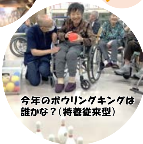
今年のボウリングキングは 誰かな？（特養従来型）