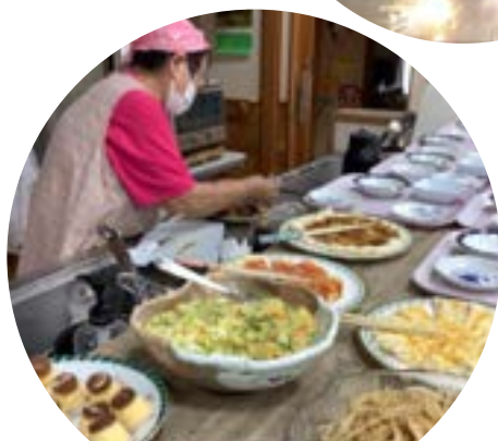
バイキングを始めました。こ の日のテーマはイタリアン！ （かじかの里）