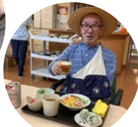
夏は冷やし中華と冷えたビール が最高！（特養ユニット型）