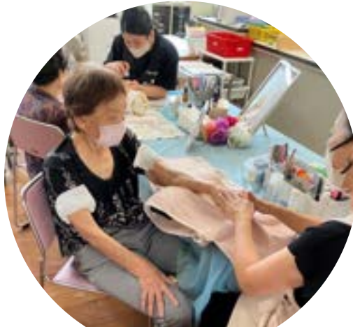
ハンドマッサージやネイルケアで 心も華やぎます。（テイサービス）